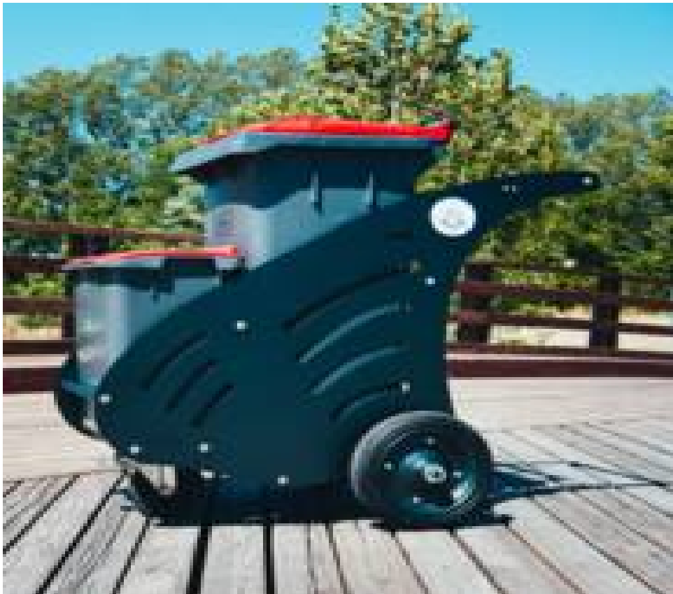
Εικόνα 2- Χρωματισμός χειραμαξιδίου